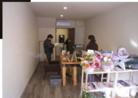
リニューアル後の店舗の様子 ▶