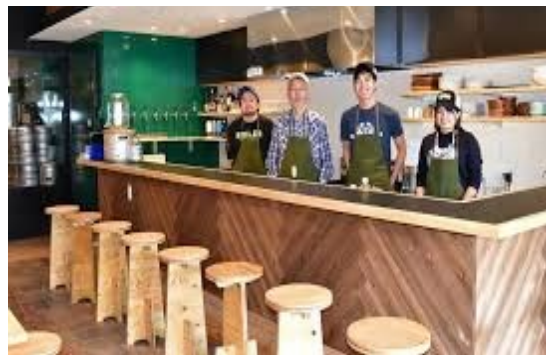
<空き店舗を活用し地域おこし協力隊が創業>

中心市街地の空き店舗へ出店する者に対し、店舗の内装又は給排水設備工事の費用の一部を助成。