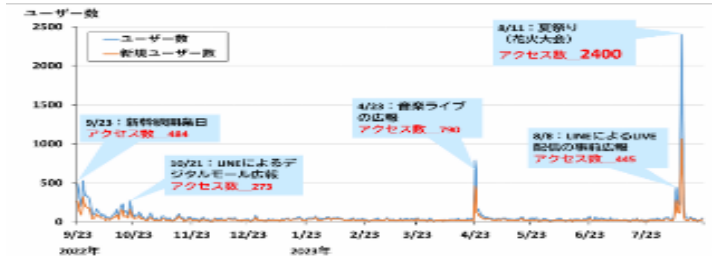
▲デジタルモールへのアクセス数の推移