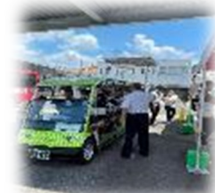
▲ルート体験会の実施状況