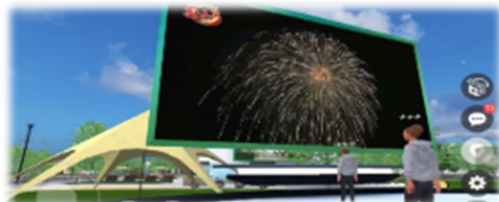
▲花火大会のライブ配信