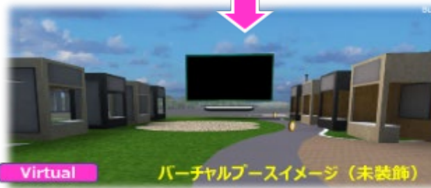
▲バーチャル上で楽しめるECマルシェの実証