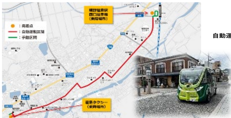
▲体験試乗会のルートと実験車両