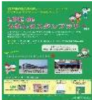
▶スタンプラリーのチラシ