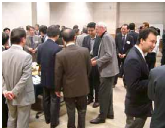
新横浜 IT クラスター交流会