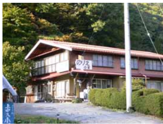
農山間地域に点在する農家民宿