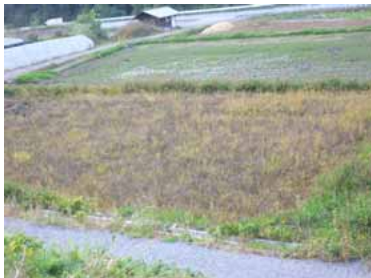
田園地帯に点在する遊休農地