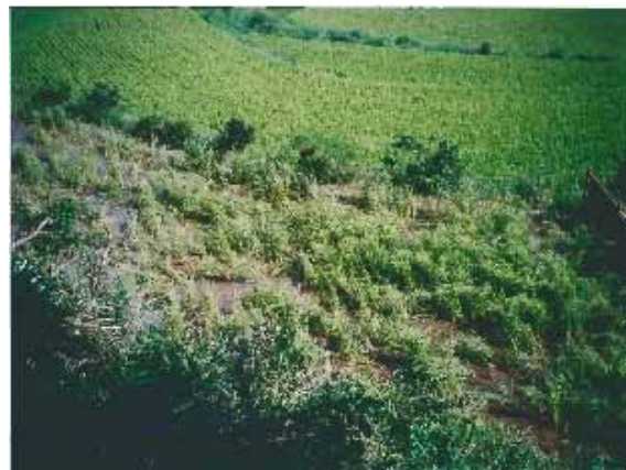
【被害にあった水田の状況】