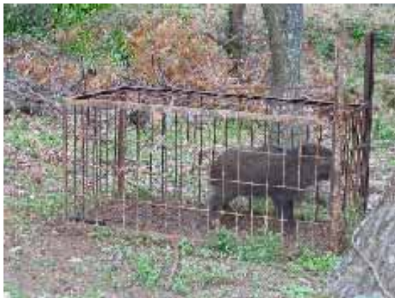
【箱わなで捕獲したイノシシ】