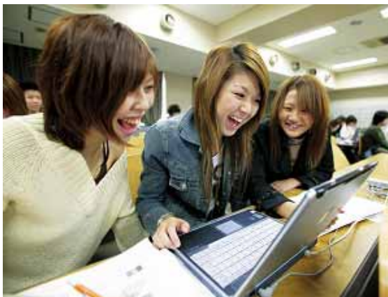
日本工学院専門学校