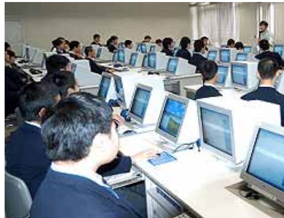
大森学園高等学校