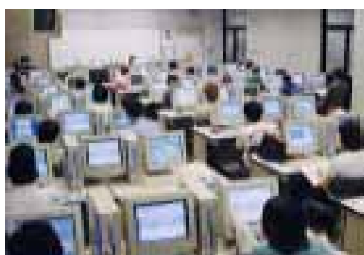
IT資格に関連する実習講座の風景