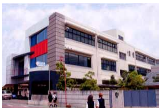
講座を設置する事業体の外観

適用される規制の特例措置： ・講座修了者に対する初級システムアドミニストレータ試験の一部免除 ・講座修了者に対する基本情報技術者試験の一部免除