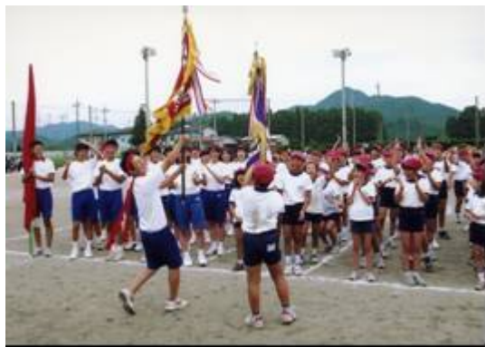
小・中学校合同の運動会

適用される規制の特例措置： ・ 特区研究開発学校の設置（教育課程の弾力化） ・ 特区研究開発学校における教科書の早期給与