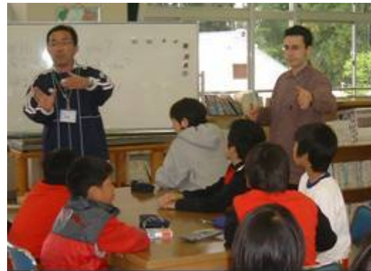
小学校の英語活動