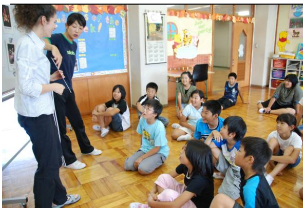
学級担任と外国人英語講師による英語科授業