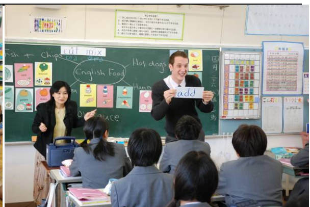
英語科教員と外国人英語講師による拡充英語科授業