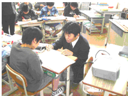
小中学校兼務教員による小学校での学習指導 「第6学年算数科」