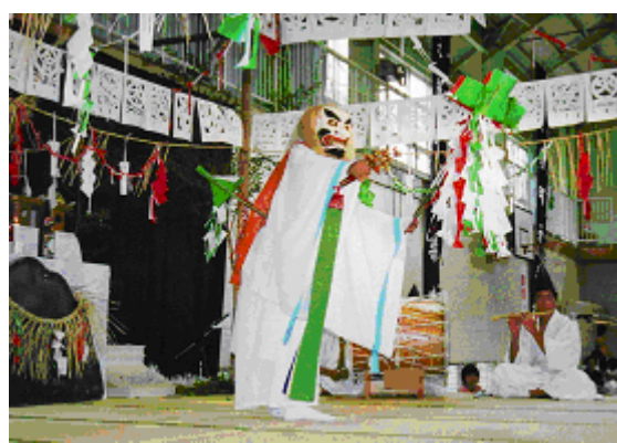
地域の歴史や文化、自然、産業等について小・中・高等学校12年間を通して学ぶ「地域学」