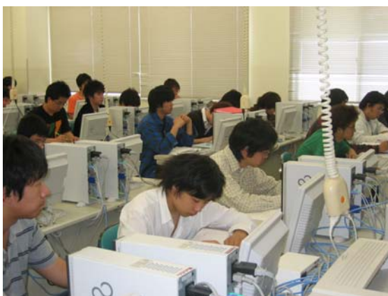
IT 関連資格の取得を目指す講座の様子