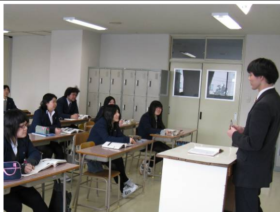
基本情報技術者講座の授業風景