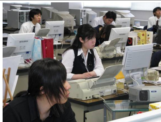
資格取得に向けて取り組む受講生達