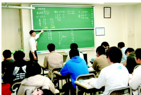
情報処理技術者試験講座の講義風景