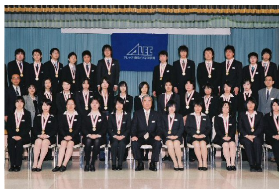
情報処理技術者試験等合格者への金メダル授与式