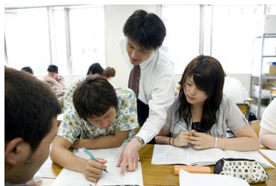
資格取得に向けて熱心に取り組む受講生