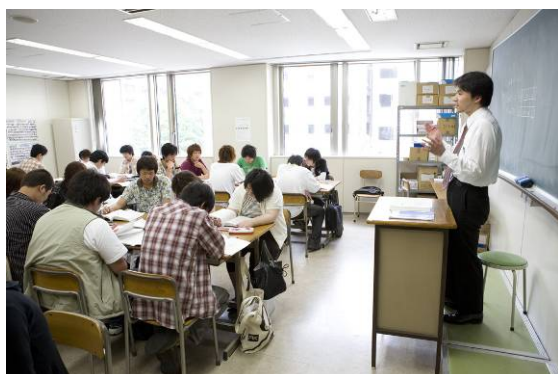
情報処理講座の授業風景