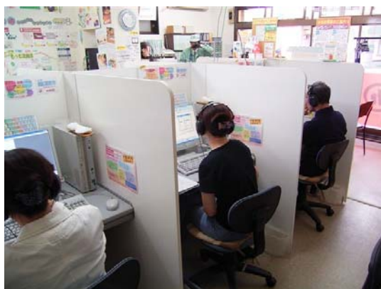
パソコン教室による個別学習