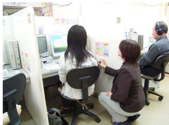
講師による個別指導