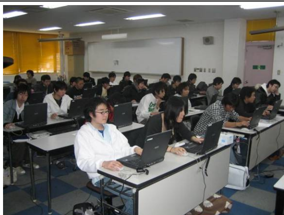
I T 資格に関する講座の様子