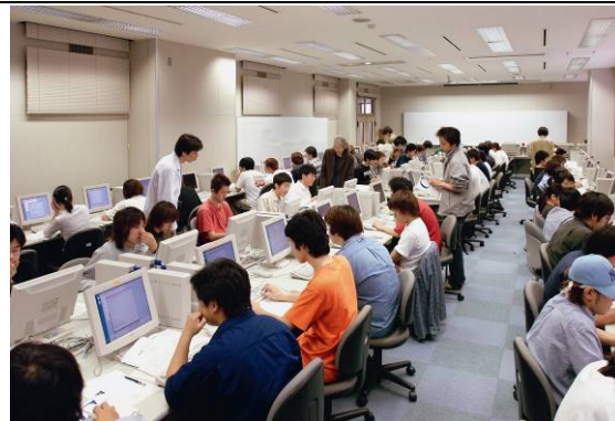
情報処理関連の授業の様子