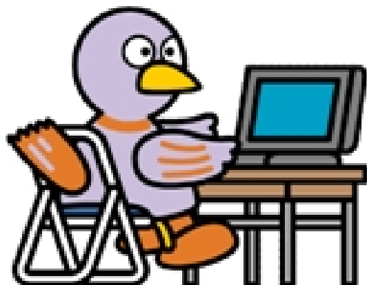
埼玉県のマスコット コバトン