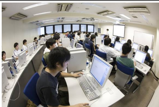
講座運営者授業風景