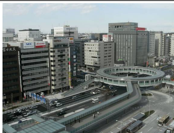
IT 関連企業集積地の新横浜地区