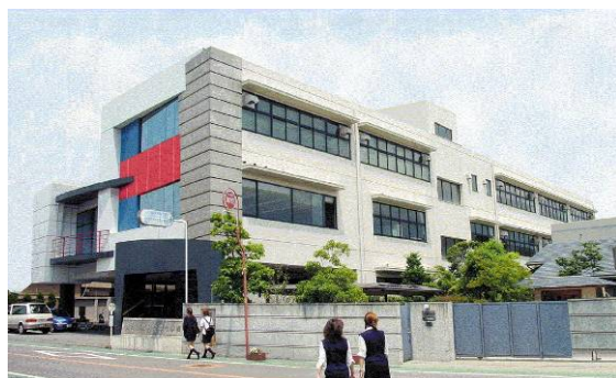
講座を設置する事業体の外観