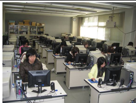
IT 資格に関連する実習講座の風景