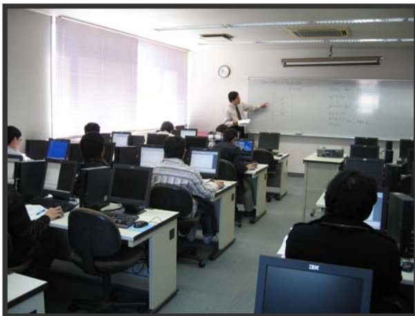
IT 資格関連講座の授業風景