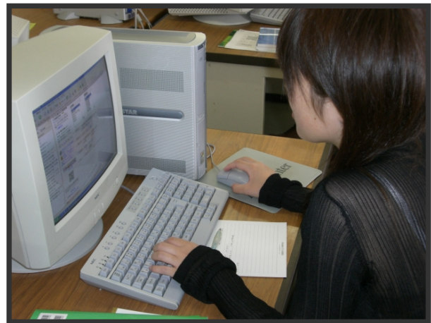
資格取得に向けて講座に取り組む受講生