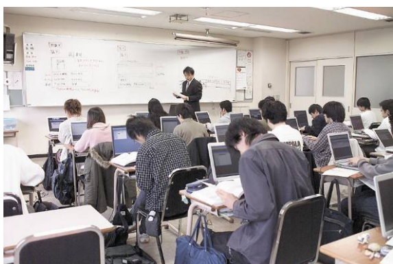
I T 関連講座の授業風景