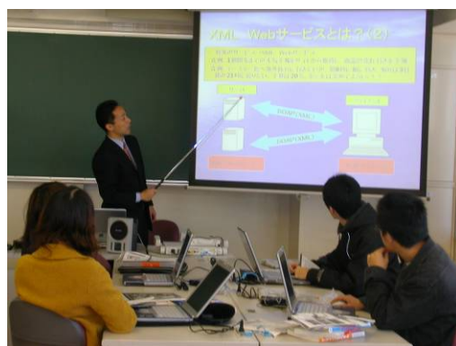
I T 関連講座の授業風景