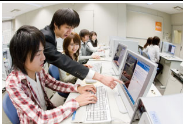
開設講座・授業風景 1