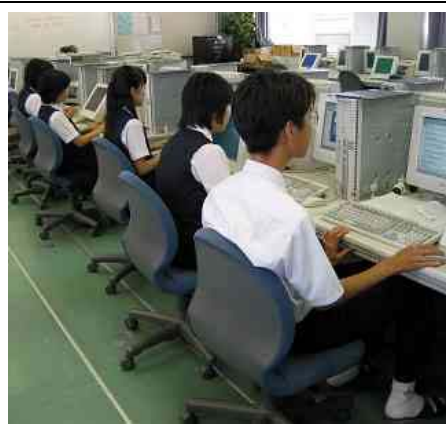
開設講座・授業風景 2