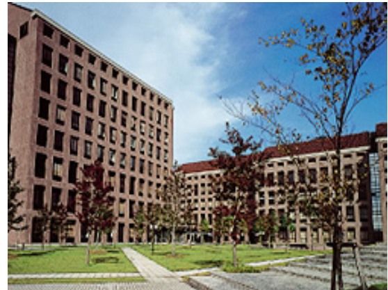
兵庫県立大学播磨科学公園都市キャンパス