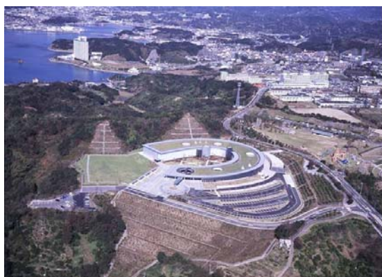
和歌山県立情報交流センター (Big・U)