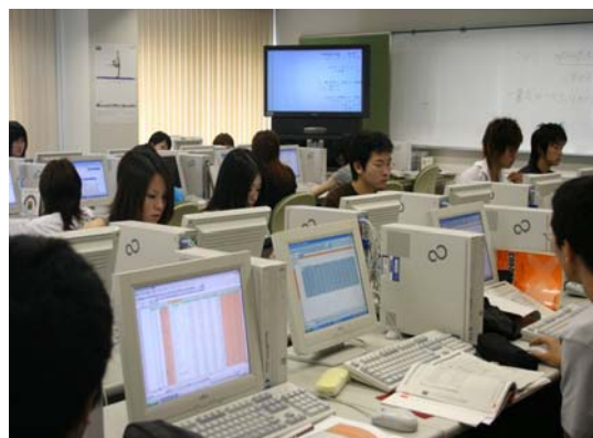
「Y I C キャリアデザイン専門学校」 I T 講座