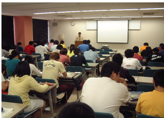
「周南市市民交流センター」 I T 講座