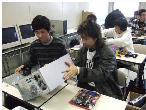
基本情報技術者講座授業風景