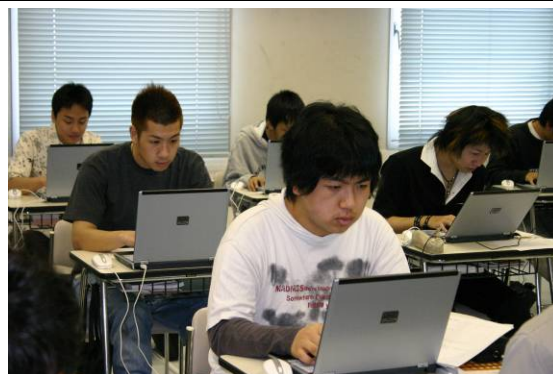
基本情報技術者講座授業風景