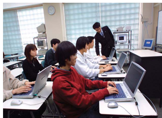
情報処理技術者試験に係る講座の授業風景