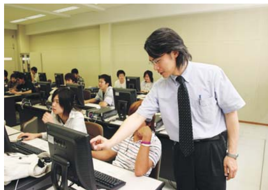
I T 資格に関する講座の様子