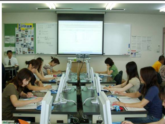
IT 資格関連講座の授業風景