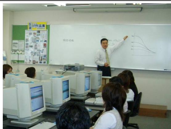
IT 資格関連講座の授業風景