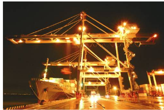
アイランドシティ国際コンテナターミナル