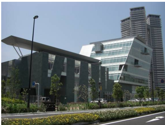
サイバー大学が入居するシーマークビル