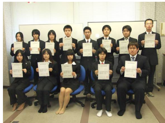
情報処理技術者試験の合格者