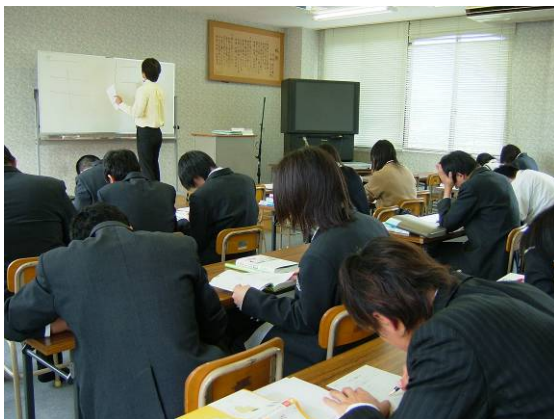
I T 講座の授業風景