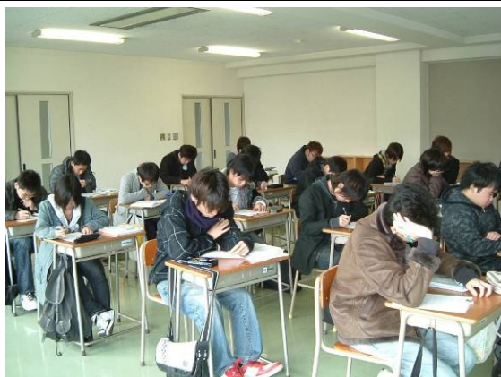
問題演習に取り組む受講生