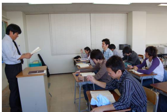
I T 講座の受講風景