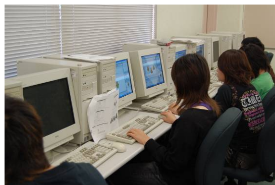
資格取得に向けて I T 講座に取り組む受講生