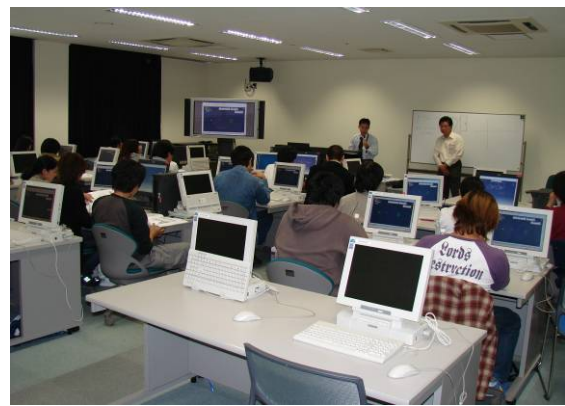
I T 講座の様子