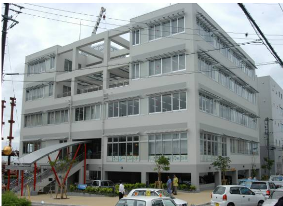
インキュベート施設（那覇市 I T 創造館）