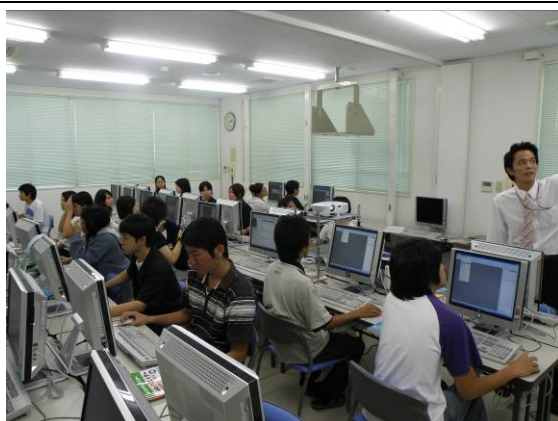
IT 関連講座の授業風景