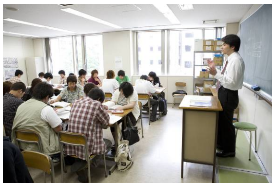
情報処理講座の授業風景