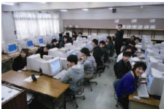
I T 資格関連の講座風景