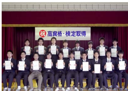
情報処理技術者試験の合格者