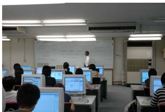
市内教育機関での講座受講の様子