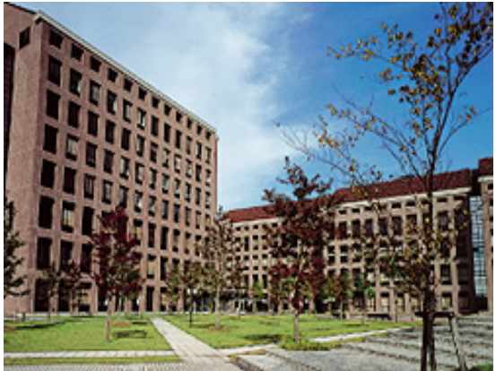
兵庫県立大学播磨科学公園都市キャンパス