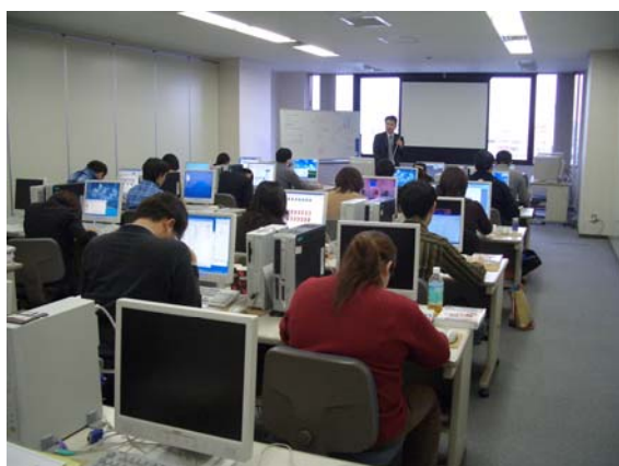
I T資格に関連する講座の様子