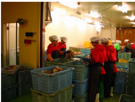
水産課工場加工技術の修得を行う