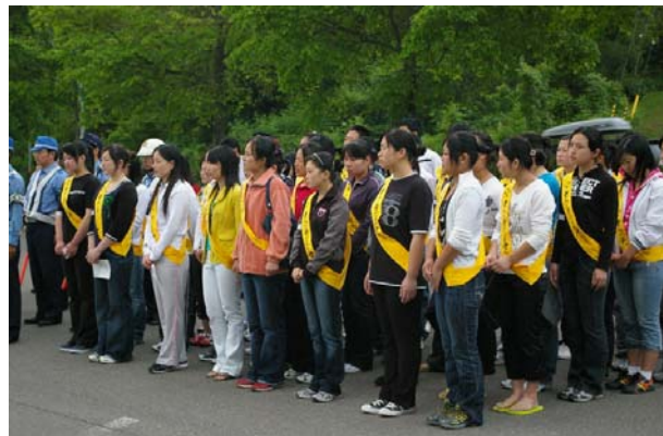
交通安全運動に地域と一体となって参加