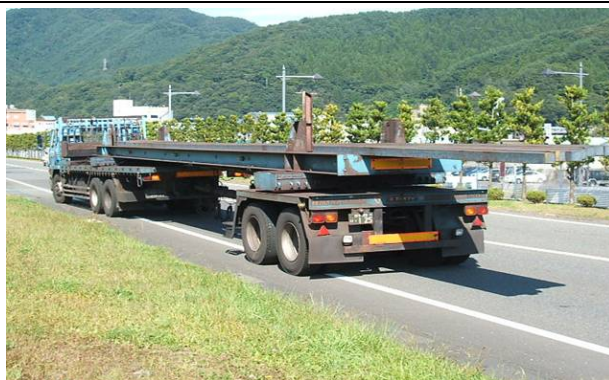
特例措置対象車両