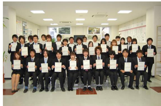
情報処理国家試験合格者