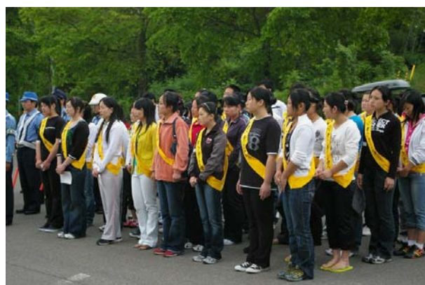
交通安全運動に地域と一体となって参加