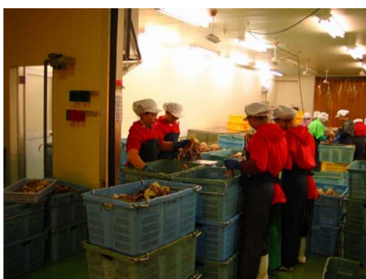
水産加工場で加工技術の修得を行う