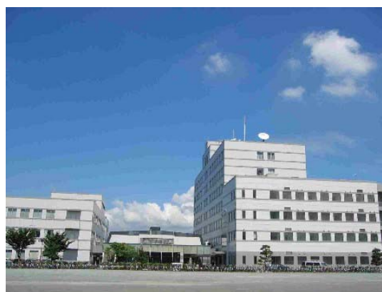
プロジェクト拠点の研究センタービルと 福岡バイオインキュベーションセンター