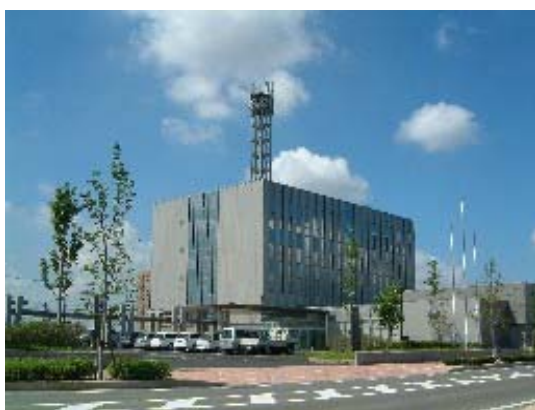
久留米ビジネスプラザビル