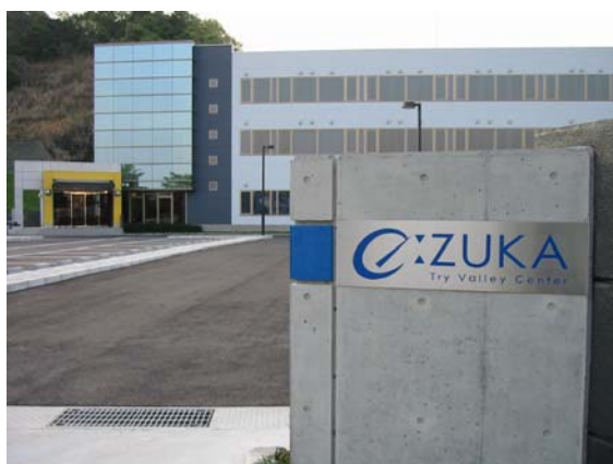
中核インキュベーション施設 【e-ZUKA トライバレーセンター】