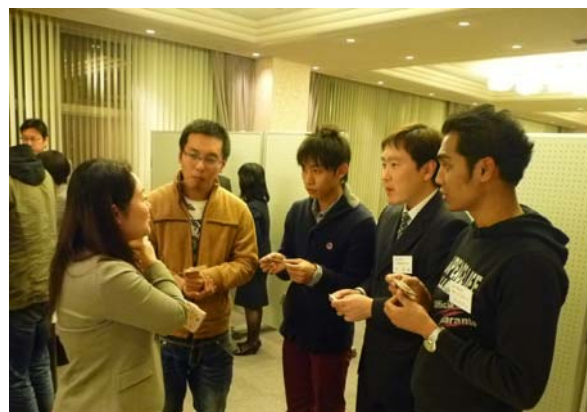
地元企業と交流する留学生