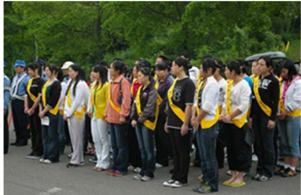
交通安全運動に地域と一体となって参加