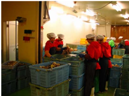
水産加工場で加工技術の修得を行う