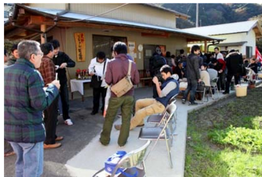
梅酒まつりでにぎわう梅酒製造所 （美郷梅酒まつり）