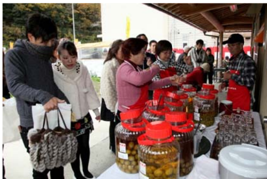
新酒の梅酒をふるまう様子 （美郷梅酒まつり）