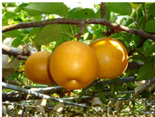
針木地区特産の新高梨