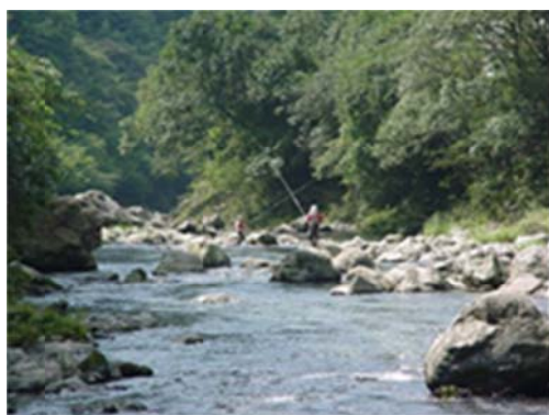
坂本龍馬も泳いだ鏡川

適用される規制の特例措置： ・ 特定農業者による特定酒類の製造事業 ・ 特産酒類の製造事業